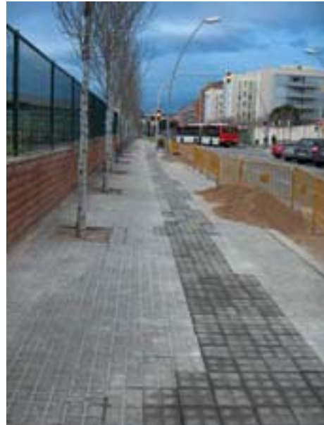
FOTO 6. Tram 3 finalitzat.