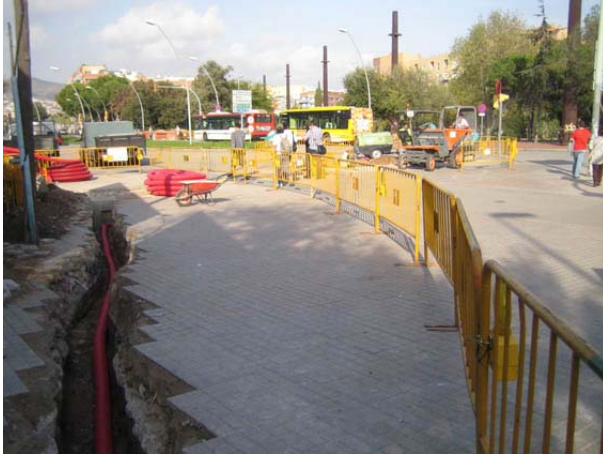
FOTO 1. Tram 1: vista general de la rasa situada davant l'estació de ferrocarrils.