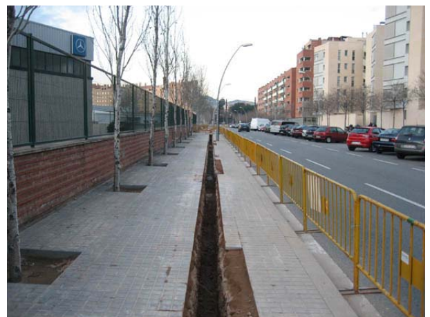
FOTO 4. Vista general del Tram 3.