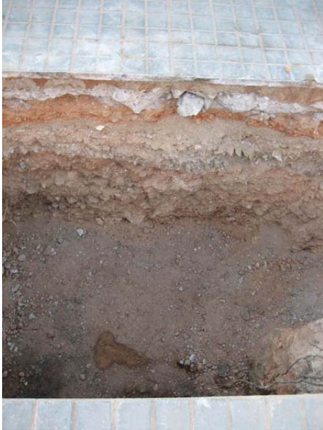
FOTO 5. Detall estratigràfic de les UE- 01, 02 i 03.